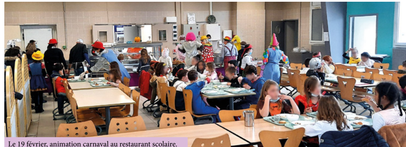
Le 19 février, animation carnaval au restaurant scolaire.

Le restaurant scolaire n'a jamais si bien porté son nom !