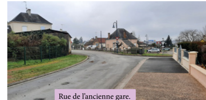
Rue de l'ancienne gare.